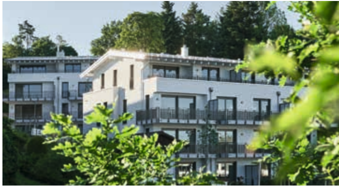
Beringerweg 36-38, Tutzing