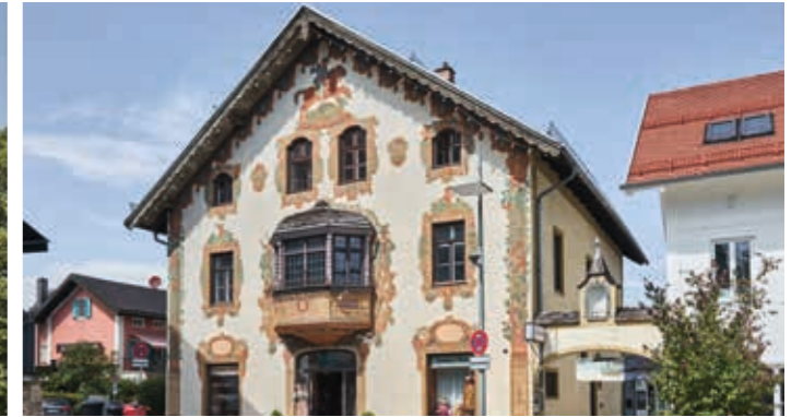
Tutzinger-Hof-Platz 3, Starnberg