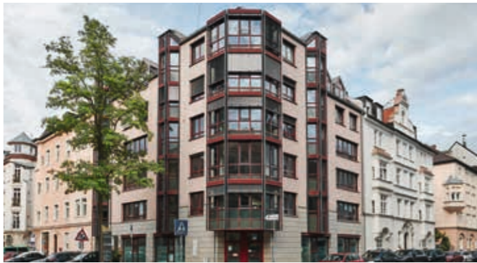
Maistraße 37, München