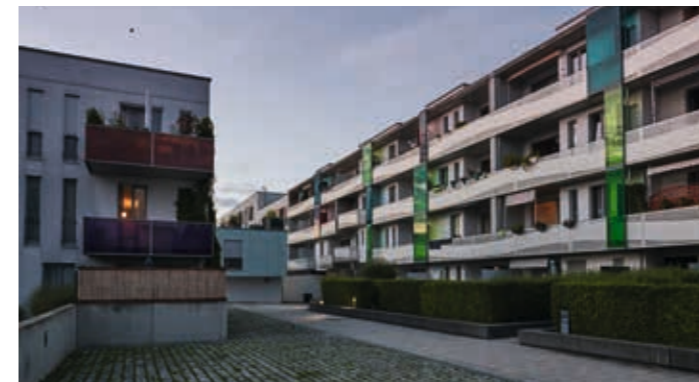
Selma-Lagerlöf-Straße 28-48, München