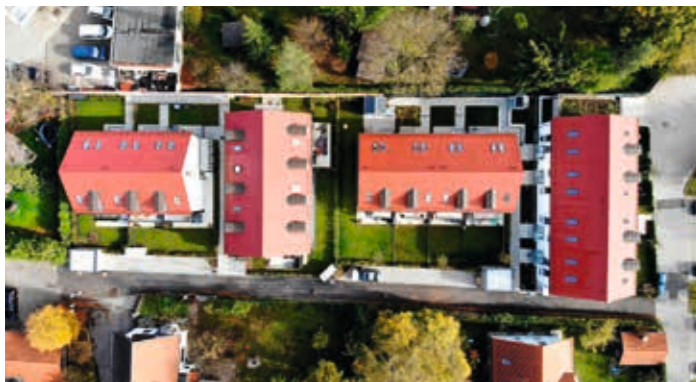
Hohenlindner Straße 32a, Feldkirchen