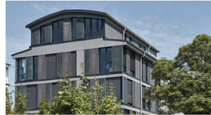
Münchener Straße 23, Haar