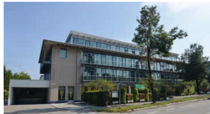
Münchener Straße 25, Haar