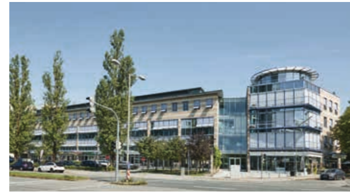
Münchener Straße 9-13, Haar