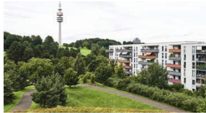
Elisabeth-Kohn-Straße 33-37, München