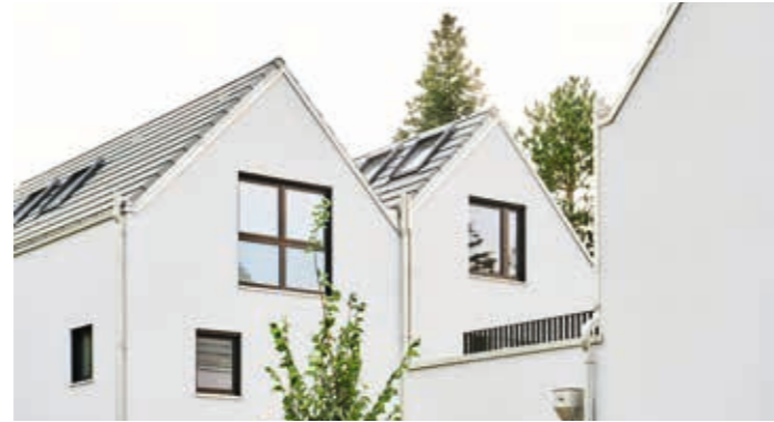
In der Heuluss 16, München